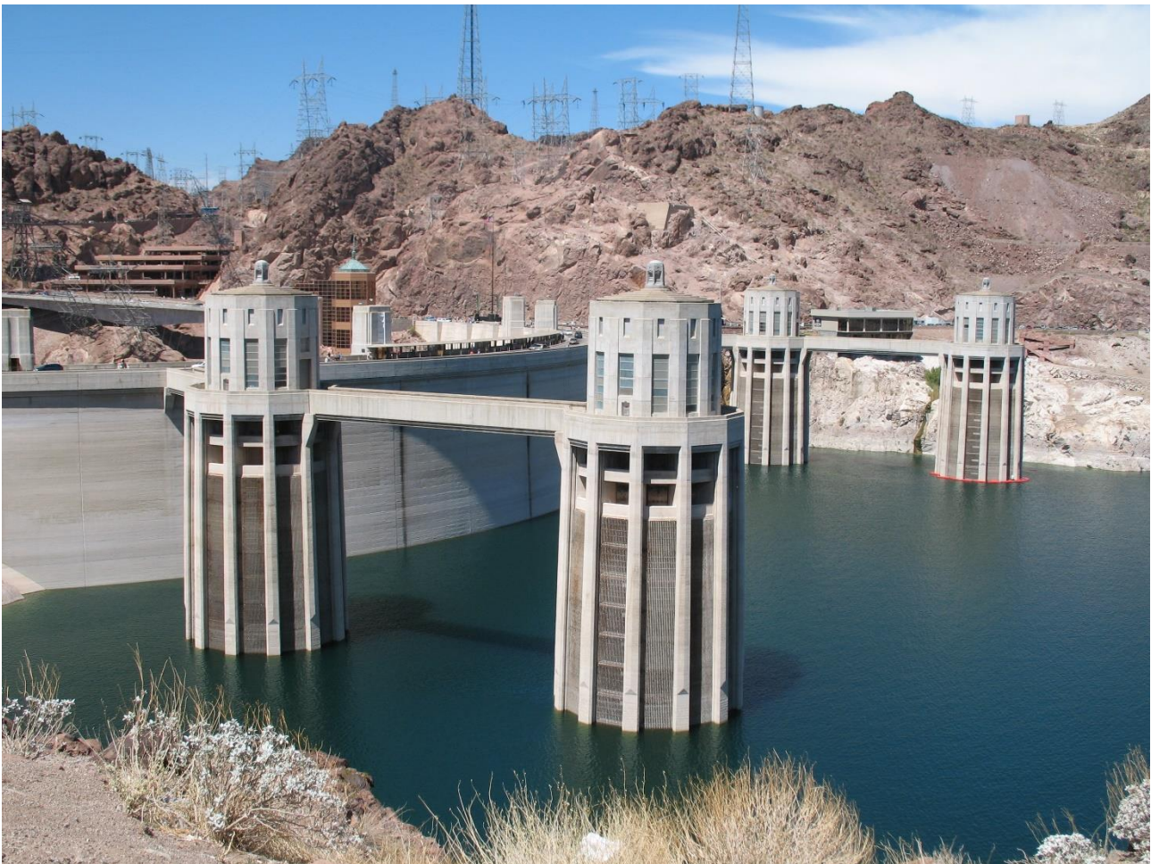
Hoover Dam met de vier Penstock waterinlaat-torens, Penstock Torens genaamd. Via deze torens wordt water uit het reservoir gefilterd en gecontroleerd binnengelaten en via de penstocks verder door de dam geleid

Penstock: als tijd schaars is en de behoefte aan betrouwbare informatie groot. Zie penstock.online